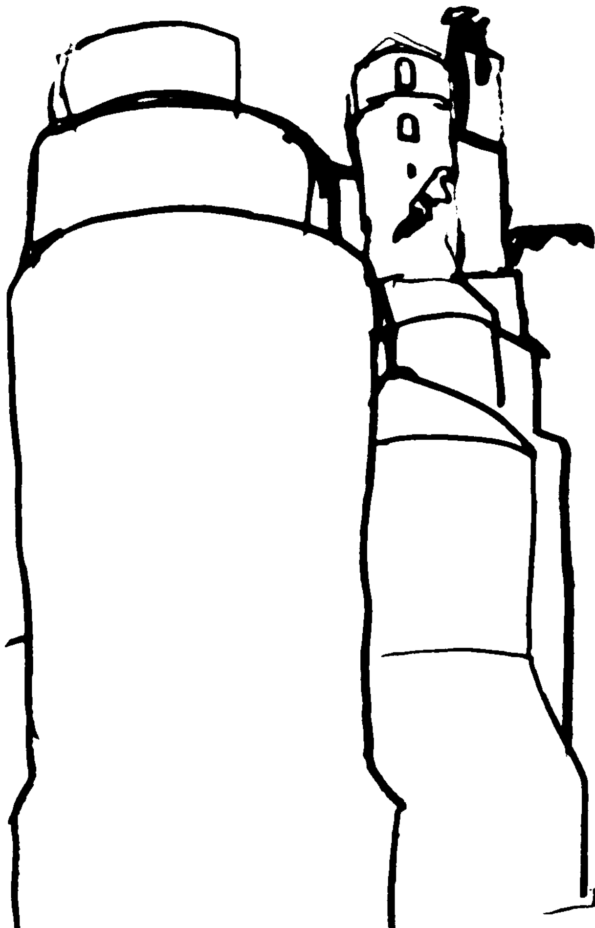
St.-Cécile Cathedral, Albi, Francia, dibujo de Louis I. Kahn, 1959, tomado del libro «The Notebooks and Drawings of Louis I. Kahn», Falcon Press, New York, 1962.