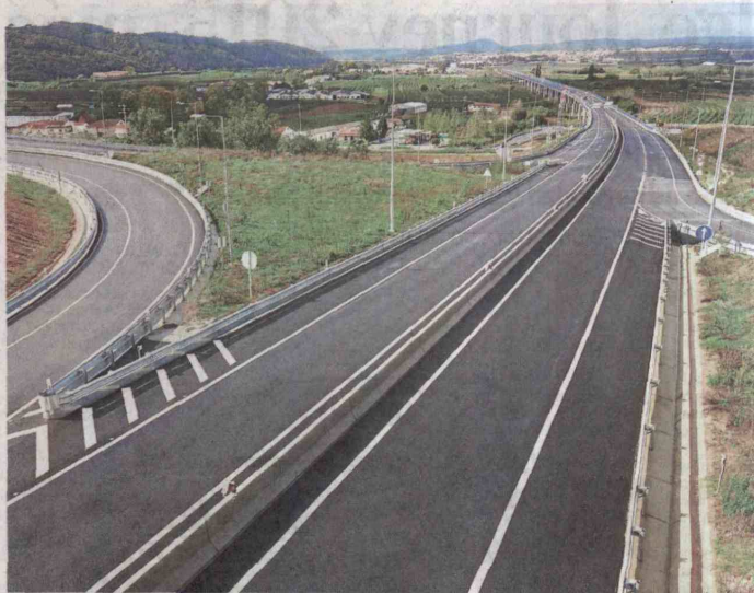
La educación, una buena infraestructura vial y políticas estatales son claves para lograr una adecuada seguridad vial en el país.

Entre las recomendaciones dadas por los panelistas invitados está la de garantizar la seguridad vial a los niños y la implementación de programas de educación vial, para así crear una cultura