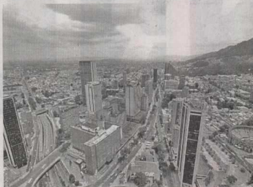
Bogotá será la primera ciudad latinoamericana en recibir este evento que se realiza desde 1999. La Cumbre Mundial de Premios Nobel de Paz. En ocasiones anteriores, a la Cumbre han asistido personalidades tales como el Dalai Lama, Mikhail Gorbachev, Jimmy Carter y Desmond Tutu.