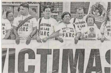
Los 54 integrantes de la Mesa Nacional de Víctimas se darán cita durante este fin de semana en Villavicencio para hablar sobre los avances en la atención y reparación de víctimas y aclarar dudas sobre los acuerdos de paz. El evento será presidido por ministro del Interior, Juan Fernando Cristo.