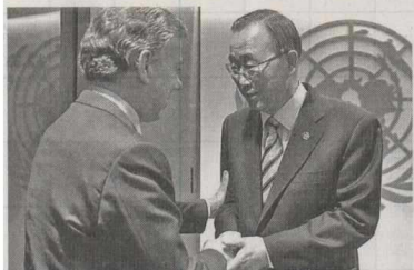
El Secretario General de la Organización de las Naciones Unidas, Ban Ki-moon, confirmó que asistirá a la firma del Acuerdo Final para la Terminación del Conflicto y la Construcción de una Paz Estable y Duradera pactada entre el Gobierno de Colombia y las Farc el próximo 26 de septiembre.