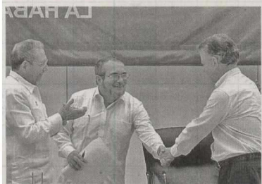
La ONU puso como ejemplo el reciente acuerdo en Colombia para recordar el Día Internacional de la Paz. La entidad aseguró que este proceso servirá de ejemplo en otras regiones del mundo y ayudará para que otros países que viven en medio del conflicto involucren el diálogo para conseguir la paz.