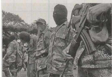
El territorio indígena de la alta Amazonia de Colombia, rico en oro, al parecer atrae a miembros de las Farc, que lejos de desmovilizarse en el marco del acuerdo de paz con el gobierno, buscan apropiarse de la zona, señalaron a la AFP autoridades y líderes comunales.