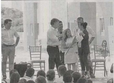
El presidente de la República, Juan Manuel Santos, destacó la política de vivienda como una de las más importantes para tener un país libre de violencia, y por tal razón este es uno de los sectores más importantes para el Gobierno Nacional. Con el programa 'Mi Casa Ya' se han seleccionado 141 proyectos.