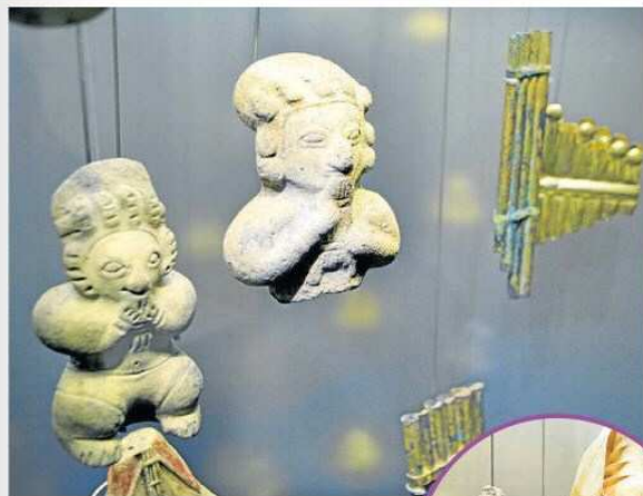
LAS COLECCIONES FUERON restauradas al ciento por ciento y son exhibidas en las diferentes salas.

4 años demoró la reapertura del Museo del Oro que tiene nuevas colecciones.