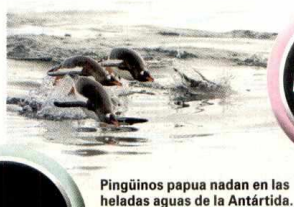
Pingüinos papúa nadan en las heladas aguas de la Antártida.

Las universidades Jorge Tadeo Lozano, Antioquia, Javeriana, Los Andes, Tecnológica de Bolívar, Sabana, Nacional, La Salle, y entidades como la Dirección General Marítima, la Comisión