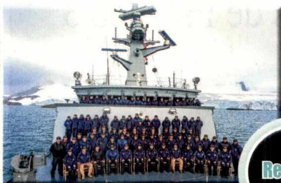
Delegación que viajó en el ARC 20 de Julio.

La primera Expedición a la Antártida se realizó entre el 2014 y el 2015, y la segunda entre el 2015 y el 2016.