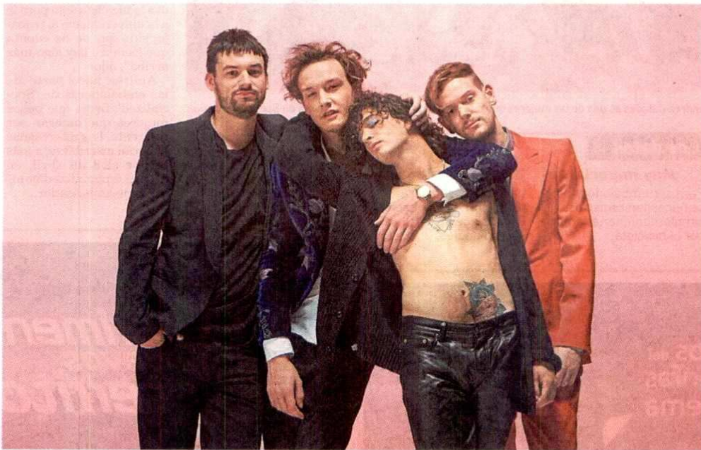
Los cuatro integrantes de la banda se conocieron desde el colegio, fue entonces cuando nació este proyecto musical. A. PARTICULAR

Diez años después, ya madurados musicalmente, grabaron su primer EP ‘Facedown’, trabajo en el que se destaca el sencillo ‘The City’, al año siguiente publicaron el que sería su primer trabajo discográfico titulado ‘The 1975’, con el cual la crítica fue dura, pese a que alcanzó el número uno en Reino Unido.