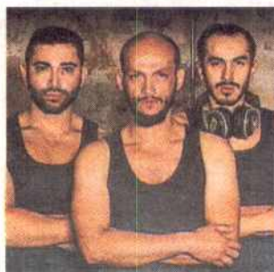
Protagonistas montaje. EL CLAN

BOGOTÁ. La obra de teatro 'De psicópatas y otros hombres' es un drama policiaco acerca de una mujer que fue ultimada por un asesino serial conocido como El Psicópata. En temporada hasta el 13 de mayo de jueves a sábado a las 8:00 p.m. (Cll. 59 #17-48).