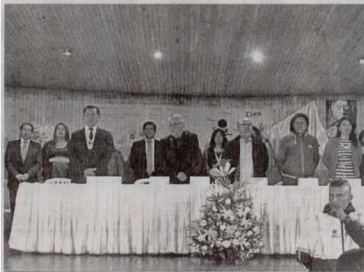
El programa 'Distrito Joven' de la Alcaldía Mayor y que lidera el IDIPRON, graduó a 529 jóvenes en Contabilidad, Desarrollo de Operaciones Logísticas, Mantenimiento de Equipos de Cómputo, Programación de Software, Recursos Humanos y Sistemas, entre otros.