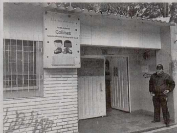
La Secretaría Distrital de Integración Social informó que con el objetivo de mejorar la calidad en la prestación de los servicios sociales de sus unidades operativas, iniciará arreglos locativos al Jardín Infantil 'Colinas', ubicado en la localidad de Rafael Uribe Uribe. Los trabajos comenzarán el próximo 28 de noviembre.