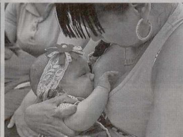
Con una participación de más de 400 personas, se realizará el 'Primer Encuentro Nacional de Salas Amigas de la Familia Lactante'. El encuentro es convocado por la Mesa Técnica de Salas Amigas de la familia Lactante que lidera la Secretaría Distrital de Integración Social y el Ministerio de Salud y Protección Social.

SIENDO ESTA UNA MANERA DE IMPLEMENTAR LA PAZ EN LAS LOCALIDADES