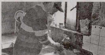
El acueducto comunitario cuida y protege las quebradas de Sumapaz.

tecian de forma irregular de las quebradas de Sumapaz, sin los permisos que otorga la autoridad ambiental, además sin un debido control en el consumo del agua. Ahora, gracias a la gestión de la Secretaría del Hábitat el acueducto del corregimiento de San Juan es legal y tiene una mejor infraestructura. Se instala-