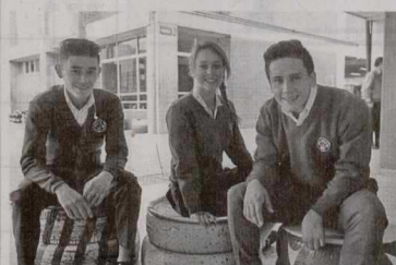
Este viernes 25 de noviembre, el Distrito llevará a cabo una jornada especial informativa para que jóvenes egresados del sistema educativo oficial de Bogotá del año 2005 en adelante, de estratos socioeconómicos 1, 2 y 3, participen en la convocatoria del Distrito que ofrece créditos hasta 100 por ciento exonerables para adelantar estudios en programas técnicos profesionales y tecnológicos.