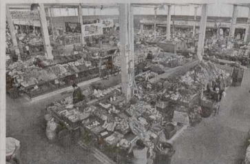
El IPES informó que está abierto el proceso de adjudicación de puestos, bodegas y locales en 12 de las 19 Plazas de Mercado para la venta de frutas, verduras, cárnicos, pescados, hierbas, misceláneos, restaurantes y abarrotes, entre otros. Las Plazas son: Doce de Octubre, Kennedy, Santander, Trinidad Galán, Ferias, Cruces, Fontibón, Veinte de Julio, San Carlos, El Carmen, San Benito y Los Luceros.