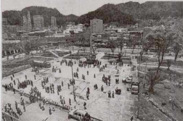
Las jornadas de recuperación se vienen llevando a cabo en toda Bogotá.

El sábado 26 de noviembre del 2016 de 8:00 a.m. a 12:00m., la Alcaldía Local de Los Mártires con el acompañamiento de las entidades distritales como: Las Secretarías de Ambiente e Integración Social, Aguas de Bogotá