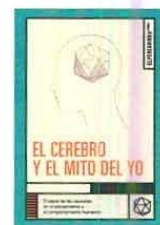
El cerebro y el mito del yo, Rodolfo Llinás El Peregrino 329 páginas

Al partir de una explicación biológica y evolucionista del surgimiento de la cognición, Llinás argumenta que el "yo" o el "sí mismo" solo aparece cuando existe el sistema nervioso y por lo tanto no hay ningún tipo de trascendencia en el hombre. O en palabras de Llinás: "La subjetividad es la esencia constitutiva del sistema nervioso (...) la conciencia, como sustrato de la subjetividad, no existe fuera del ámbito de la función del sistema nervioso". Una afirmación demoledora en términos filosóficos y religiosos, ya que buena parte de todos nuestros sistemas de pensamiento, morales, cultu-