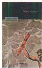
Sobre el poder, Byung-Chul Han Herder 184 páginas