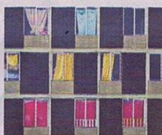
ALEX VISBAL. Fotógrafo de la revista 'National Geographic'.