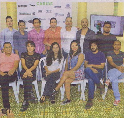
Artistas que participarán en la Feria del Millón.

En la antigua fábrica de Coltabaco, que próximamente será la Fábrica de la Cultura, ubicada en la calle 40 con carrera 50, se realizará este evento que busca que todos los barranquilleros puedan acceder al arte.