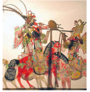
El Tangshan Shadow Show Troupe se fundó en 1943.