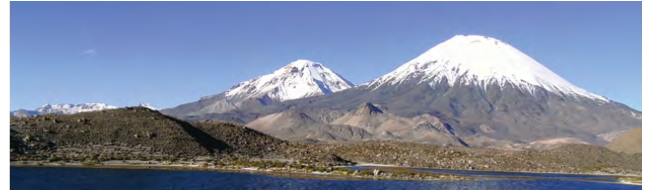
Panorámica de la costa chilena sobre el Pacífico.

Por: Saúl Castellar Arrieta - saul_a66@hotmail.com Programa de Relaciones Internacionales Semillero de Investigación SIESDAL