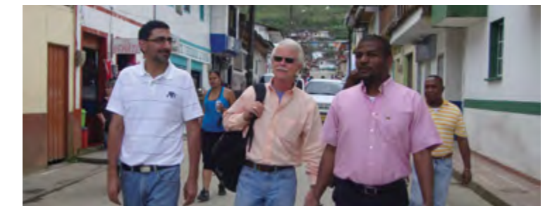
En el Chocó existe cooperación internacional

En especial, porque es evidente que la intervención que tiene la sociedad civil en los proyectos de desarrollo patrocinados con recursos internacionales es casi nula y, por lo tanto, no cumple con los principios que se pregonan de gobernanza y eficacia. Hay que tener en cuenta que el protocolo y el gran proceso que lleva un proyecto o un programa de cooperación debe incluir la participación pasiva o activa del grupo que recibirá ayuda. En tanto esto ocurra, la cooperación en Colombia cambiará de manera positiva.