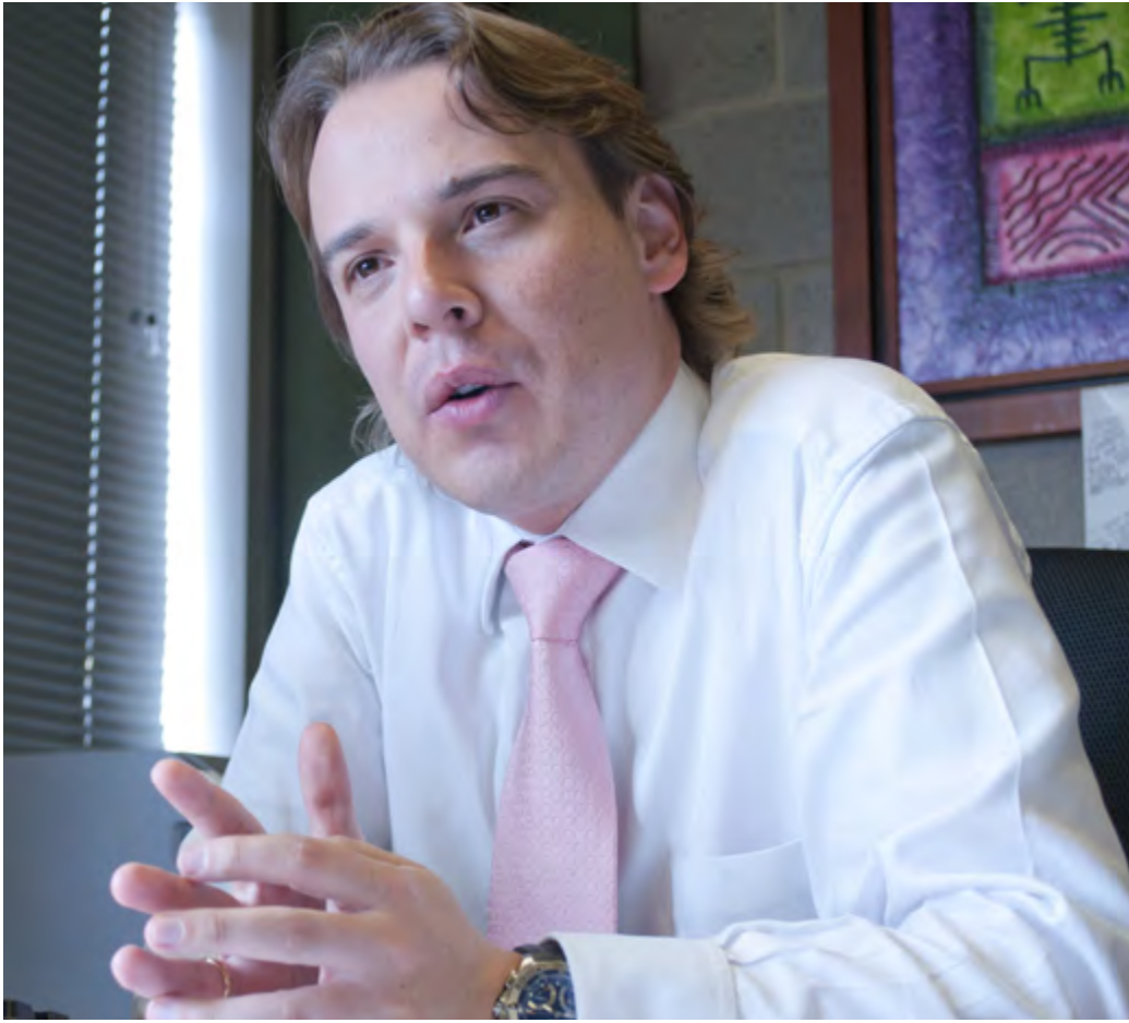
Decano Programa de Derecho

J.M.O.: Yo creo que vale la pena hacer referencia a la historia del programa, porque es uno de los más antiguos dentro de la Institución, percibido como uno de los más sobresalientes e importantes. En materia de relaciones internacionales, en el país; ha hecho aportes fundamentales tanto al servicio exterior colombiano como a diferentes aspectos de la política internacional. De cara al futuro, nosotros le apostamos a que el programa siga respondiendo a la evolución de la disciplina y que nuestros estudiantes se puedan desenvolver con toda solvencia, tanto en el área diplomática como en los diferentes campos que ofrecen, hoy en día, las relaciones internacionales. Es decir, que nuestros egresados se puedan desenvolver en diferentes entidades del orden gubernamental, tanto a nivel local y regional como nacional; en empresa privada, en la academia, en organizaciones no gubernamentales y, por supuesto, en el sector internacional.