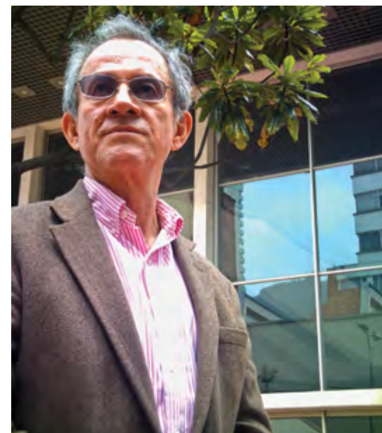
Fotografía: Javier Melo

El profesor Melo ha sido además coeditor de muchas revistas y miembro permanente de los consejos editoriales de prestigiosas revistas nacionales. Su obra intelectual y su aporte al país son altamente reconocidos. Es por esto que para la Universidad Jorge Tadeo Lozano y la nueva Facultad de Ciencias Sociales es un orgullo y un privilegio contar con la dirección de un hombre que conoce de cerca los problemas y las necesidades del país. Esta experiencia será muy útil para orientar las políticas de la facultad y cumplir junto al resto de la Universidad las misiones que nos hemos trazado.