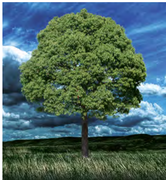
“Seguridad alimentaria y crisis humanitaria”, tema Von Humboldt

No existe una legislación internacional que haya desarrollado las leyes de la migración internacional aún. Dentro de las gestiones a desarrollar por los Estados, se debe concebir una práctica y una legislación para gestionar la migración efectiva. Deben ser consistentes dentro de un contexto legal internacional que se puede incluir dentro de la constitución de cada Estado. El código penal, los tratados internacionales, las convenciones e instrumentos y herramientas regionales y locales, dentro de los mismos Estados, se deben suscribir, cumplir y penalizar para que tengan efectividad. También debe estar influenciada por otros elementos, dentro del marco legal general del Estado, cobijando al migrante con seguridad, educación, vivienda, salud pública e igualdad de condiciones en competencias educativas, culturales y sociales. Esta buena gobernanza de la migración podrá aportar, también, beneficios enormes para el desarrollo recíproco entre el hemisferio global. Eso sí, se debe tener siempre en cuenta el reconocimiento y la identidad legal dentro de la sociedad.