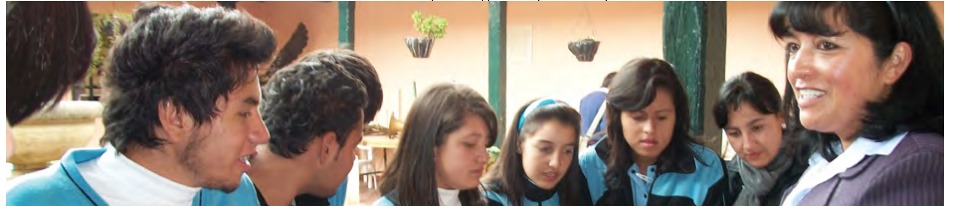
El Estatuto Juvenil debe ser aprobado en la actual legislatura

el jueves para irse de vacaciones antes del 20 de junio. Esperamos que en esta legislatura, el proyecto alcance a cumplir todas las expectativas y lo haga sin inconvenientes, ya que cuenta con el apoyo de todas las bancadas y todos los congresistas están de acuerdo en que exista una normatividad que regule a los futuros líderes de nuestro país. La intención, entonces, es que este proyecto no quede en el olvido, como una palabra más, si no que cuente con un seguimiento para asegurar su pleno cumplimiento.