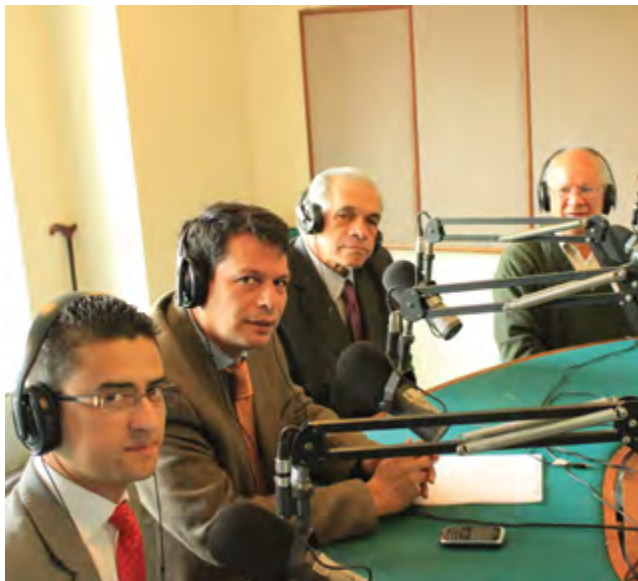
Radio Café del Mundo, al aire

El Programa de Relaciones Internacionales de la Universidad Jorge Tadeo Lozano viene adelantando una iniciativa de programa radial: se trata de Radio Café del Mundo, que busca generar, desde la Universidad, escenarios de debate y reflexión sobre los temas de coyuntura nacional e internacional. Es de nuestro interés extender este esfuerzo hacia la comunidad tadeísta y poder llegar a una audiencia cada vez mayor, a través de la emisora HJUT 106.9 F.M. La finalidad y espíritu del programa para por servir a la sociedad y generar espacios de reflexión, con mayor cobertura, para que los ciudadanos puedan gozar de la mejor información y análisis de la más alta calidad. En asocio con la emisora HJUT, el Programa de Relaciones Internacionales y Radio Café del Mundo ofrecen a la audiencia su emisión todos los sábados en el horario de 11:00 a 11:30 a.m. Para cumplir con esta gran responsabilidad de la mejor manera, el programa cuenta con la participación de un grupo de expertos en su mesa de trabajo, entre los cuales se encuentran reconocidos analistas, académicos y funcionarios públicos. La proyección social de Radio Café del Mundo se consolida con las emisiones semanales que le permiten al público en general, integrarse a la coyuntura global, bajo la premisa de incentivar el análisis y la generación de pensamiento crítico, así como las labores de investigación, estudio académico y desarrollo de procesos.