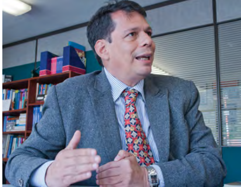
Decano Programa de Relaciones Internacionales

C.T.: ¿Qué papel ha jugado el Grupo de Investigación del Programa, con las diferentes líneas de profundización, como eje fundamental para el desarrollo de Relaciones Internacionales?