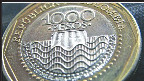
Diseño de la moneda actual de 1.000 pesos, en homenaje a la cultura Sinú.

JAIME ZAPATA VILLARREAL CULTURA@ELMUNDO.COM