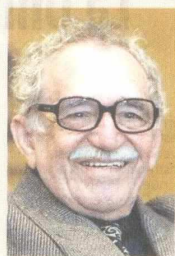
Un cuento de Gabo, en disertación.

condo del Parque Cultural del Caribe, se llevará a cabo una nueva edición de 'Hablemos de Gabo', un espacio que en esta oportunidad estará dedicado a leer, vivir y analizar "El último viaje del buque fantasma", uno de los cuentos más curiosos en la obra de Gabriel García Márquez, por ser una historia que se narra en un solo párrafo. La entrada es libre y gratuita.