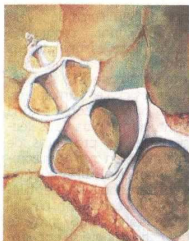
Obra de la muestra 'Vida en espiral', de Susana C.

Naar recibió formación de pintura y de óleo. Actualmente, continúa estudiando pintura con la artista Cecilia Delgado. JMB