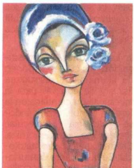
Una de las obras de 'Fantasia', de Mercedes Naar.

El pintor participó de un conversatorio, en la Intendencia Fluvial, en el que contó sobre sus inicios como artista y su experiencia en las artes plásticas.