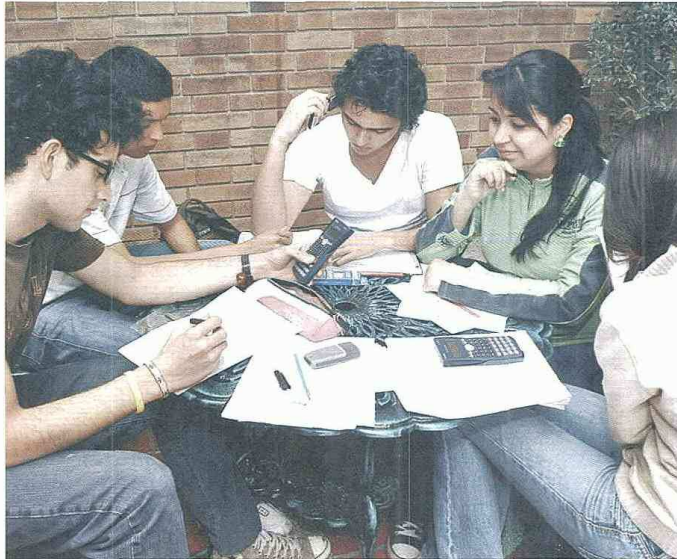
Para Ascun se debe ofrecer programas más pertinentes a las necesidades del país

Ascun se encargó de que sus consejos llegaran a manos de todos los candidatos presidenciales.