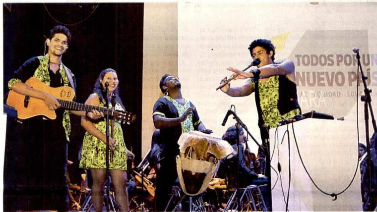
Los ritmos folclóricos de la agrupación Bozá Nueva Gaita contagiaron a los espectadores de la inauguración.

Sin embargo, una de las grandes innovaciones del lanzamiento del Festival, fue la fusión de estos ritmos caribeños con la Orquesta Sinfónica Juvenil del colegio Alemán. Música que acompañó la presentación