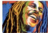
Obra del artista Javier Flórez.

La entidad Talento Humano cumple 10 años de promover la cultura nacional y promocionar a una diversidad de artistas locales en el mundo. En este tiempo, la fundación ha organizado 42 versiones de muestras pictóricas en Colombia y 5 en el exterior.