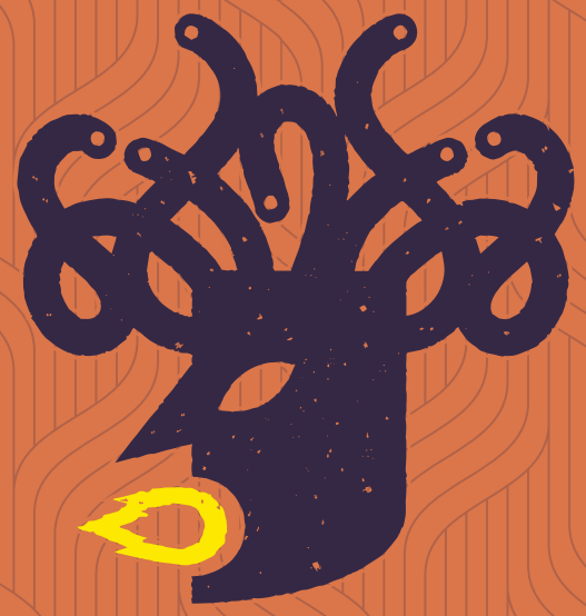
Imagen palabra 7