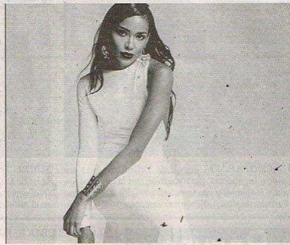
Tratándose de la producción musical este año sin duda hay grandes cambios y eso incluye a los artistas invitados a presentarse en la elección como Victor Manuelle, Piso 21, Miguel Bosé y por supuesto Luis Fonsi, todo esto es la combinación perfecta para una velada diferente.

y creo que fue por esa trayectoria que me conocieron e invitaron. ¿Ya había sido productor de reinados de belleza? Si, ya había realizado en varias ocasiones Miss World, así como Miss USA, pero es más conocido por los especiales para televisión, así como los Premios Billboard, que requiere de una exigente producción. ¿Cómo ha sido la experiencia en la producción del Concurso Nacional de Belleza? Ha sido asombrosa, con un gran equipo de profesionales de larga experiencia dentro de este concurso. También he realizado una serie de cambios, dentro de lo que cabe, porque dentro de los concursos de belleza existen cosas que nunca se van a cambiar