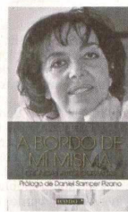
En el 2014 contó lo que hay detrás del oficio.