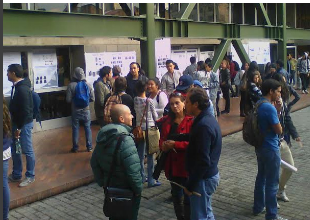
Presentación de proyectos colaborativos 2014-1

De igual forma tendrán cabida estudiantes que tengan el propósito de realizar su práctica internacional en alguna empresa del exterior que sea avalada por el programa y en donde puedan prestar servicio de apoyo docente o ser asesorados como aprendices de dicha institución. Es de aclarar que para este caso la universidad y el programa apoyan los vínculos con las instituciones y su gestión correspondiente pero no contempla apoyos o subvenciones económicas. Paralelamente los estudiantes de la práctica internacional presentan informes de su gestión y se les hace seguimiento bajo la dirección de un profesor de tiempo completo.