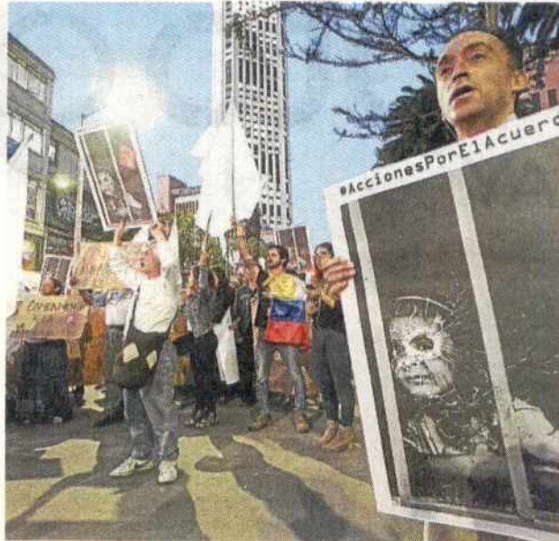
Banderas blancas y pancartas durante el recorrido.