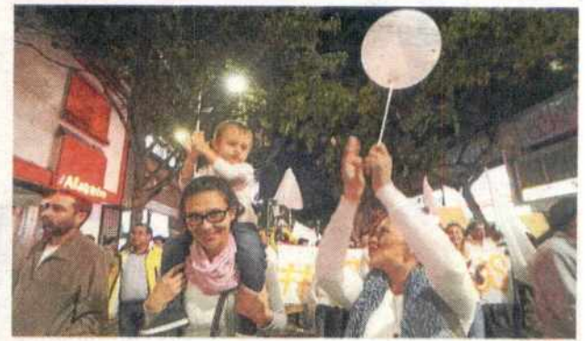
Hubo familias completas participando en otra marcha por la paz.