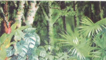
Detalle de una de las acuarelas del artista César Bertel.