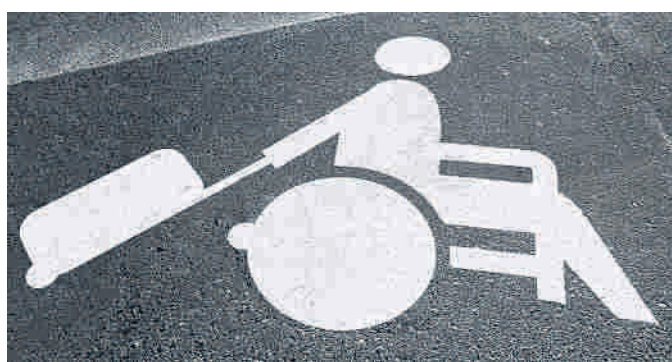
La exposición ‘Nuevo mundo’ se podrá ver hasta el 6 de agosto, en el Museo del Diseño y la Moda, de Lisboa (Portugal).

“En cuanto al diseño en sí, utilizamos el lenguaje universal de los pictogramas con un toque de humor, dignificando el hecho de viajar así se tenga una discapacidad –explica