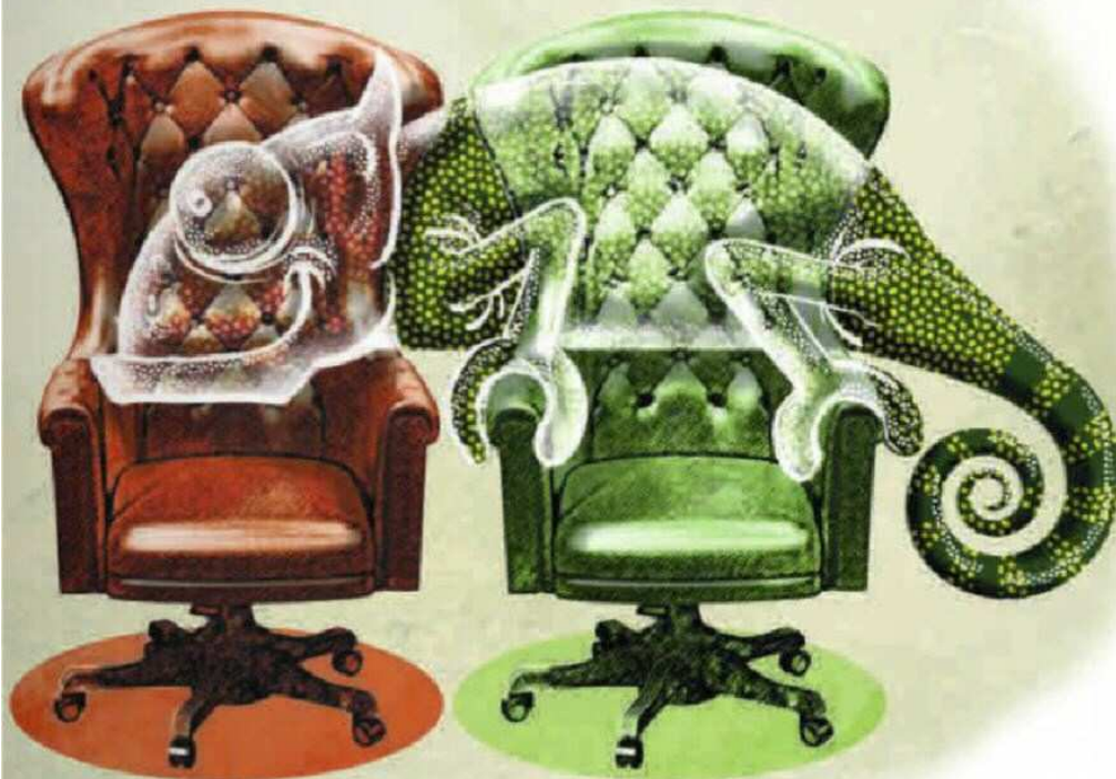
ILUSTRACIÓN ESTEBAN PABÍS