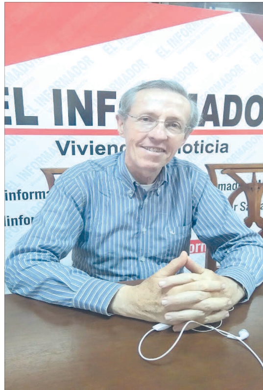
Precandidato a la presidencia de la República, Navarro Wolff en FacebookLive en el periódico EL INFORMADOR.

El precandidato a la presidencia de la República Antonio Navarro Wolff realizó visita a EL INFORMADOR y a través de redes sociales habló sobre la situación del país y su propuesta de gobierno.