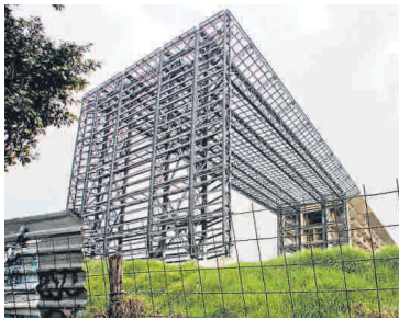
El comando de la Policía de Bogotá, un elefante blanco símbolo de la corrupción, es una de las obras que va a destruir el cupo.

Hay 100.000 millones para que la Secretaría de Inte-