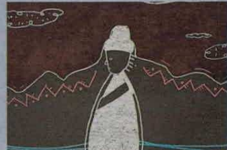
U. TADEO LOZANO

'El último pescador de Taganga', dirigido por Santiago Trujillo, es un corto de ficción sobre el peligroso avance del pez león en el Caribe. Apoyo de la Universidad Jorge Tadeo Lozano.