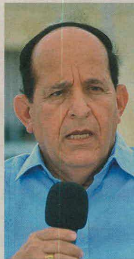
Álvaro Ashton.

a Colombia. El exgobernador de Córdoba está en Miami desde abril pasado y, por las imágenes que se han filtrado en medios, no la está pasando nada mal mientras afina los detalles de sus procesos tanto allá como en el país.