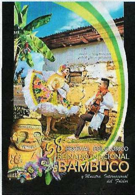
'Nuestro Huila, un paraíso mágico'.