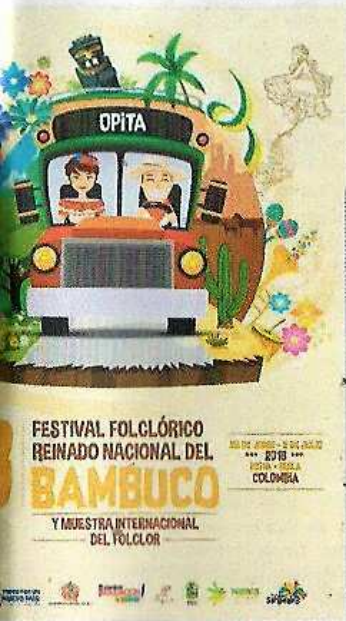
'Huila, un tierra mágica'.