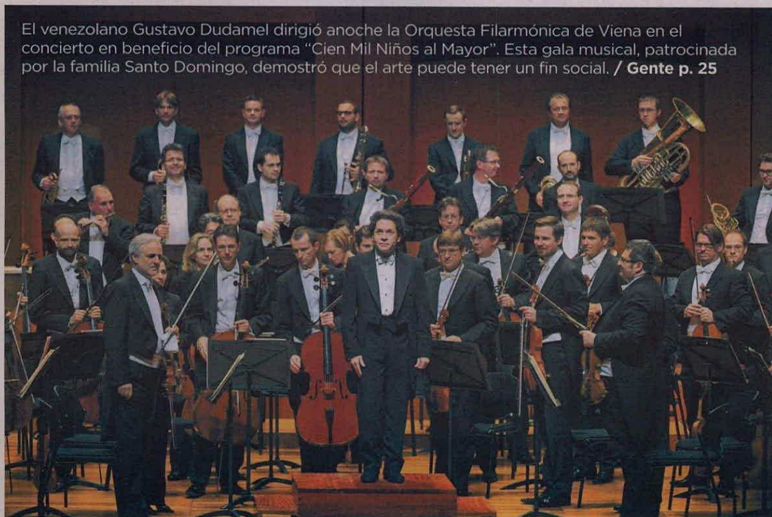
Gustavo Dudamel (centro) y la Filarmónica de Viena, al término del concierto en el Teatro Mayor Julio Mario Santo Domingo.

El venezolano Gustavo Dudamel dirigió anoche la Orquesta Filarmónica de Viena en el concierto en beneficio del programa "Cien Mil Niños al Mayor". Esta gala musical, patrocinada por la familia Santo Domingo, demostró que el arte puede tener un fin social. / Gente p. 25