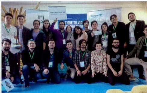
Los ganadores del primer puesto recibieron un computador Intel de 7ª generación, un paquete turístico en la casa flotante de Aviatur, dinero en efectivo y la opción de ser apadrinados en el desarrollo de la idea.

Creada a partir de las palabras "maratón" y "hacker", la expresión se originó en las empresas de tecnología afincadas en Silicon Valley, en Estados Unidos, para hacer referencia a los maratónicos en-