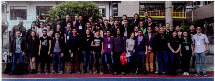
La convocatoria final de 50 personas se consideró bastante positiva dado el alto nivel de especialización del certamen.