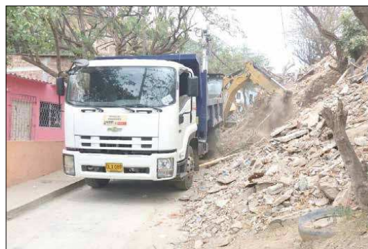
Los Comités Barriales Samarios, se encuentran realizando brigadas de recolección de escombros en los cerros y retiro de materiales sólidos y demás desechos en las alcantarillas pluviales.

Las acciones son lideradas por la Oficina de Gestión del Riesgo y Cambio Climático, en atención a la alerta roja emitida recientemente por el Instituto de Hidrología, Meteorología y Estudios Ambientales -Ideam- dando anuncio de la llegada de la época de fuertes lluvias a partir de 1