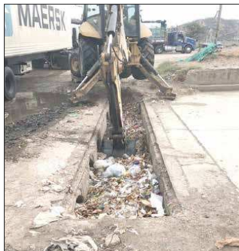
Se están limpiando los canales, rejillas, box culvert y rondas hídricas.

Los Comités Barriales Samarios realizan brigadas para el retiro de residuos sólidos en cerros y alcantarillas pluviales.