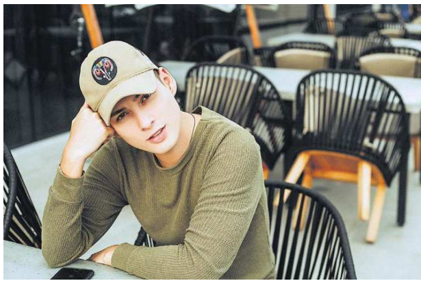
En su tiempo libre, el barranquillero disfruta ir al cine, visitar nuevos restaurantes y concentrarse en la formación de los talentos de su agencia de modelaje.