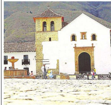
El Festival será en Villa de Leyva.

Asimismo, se premiará el Primer Concurso de Ensayo Histórico de Colombia, para lo cual se convocó a todas las Universidades que dictan Historia en Colombia, para que sus alumnos presenten ensayos relacionados con esta materia, y así promover el talento joven.