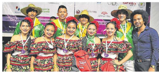
Más de 1.000 jóvenes artistas han participado en las cinco ediciones del Festival.

Desde el 2014, el Festival ha posibilitado espacios y escenarios de formación, encuentro, visibilización, reconocimiento y valoración de las manifestaciones artísticas y culturales juveniles en Córdoba, logrando en sus cinco años la participación de más de 1.000 jóvenes artistas de la música, la danza y el teatro, a un centenar de promotores y gestores culturales y alrededor de 6.000 personas entre niños, niñas, adolescentes, jóvenes