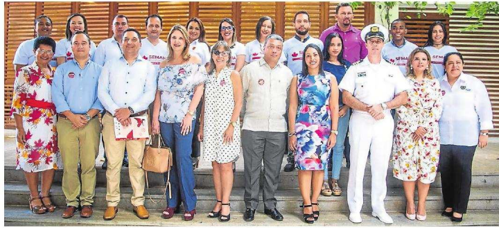
Once instituciones de educación superior de Cartagena forman parte del evento.