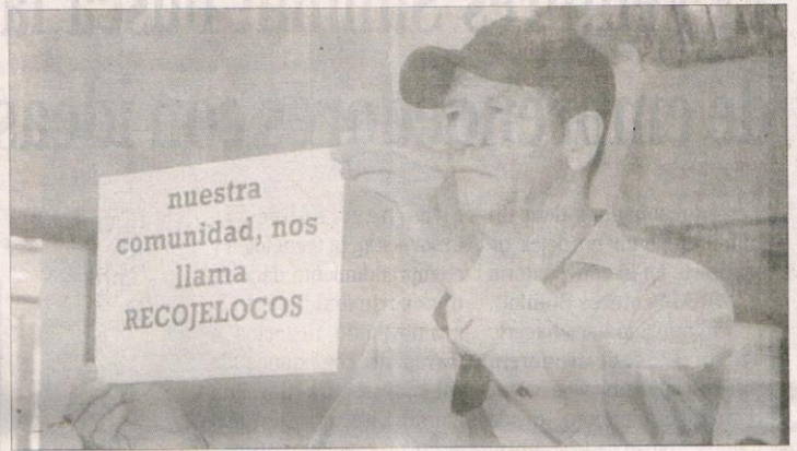
Como transporte ilegal han prestado sus servicios y beneficiado a los ciudadanos.

A lo largo de los años, los residentes de los barrios Torices, Paseo Bolívar, Nariño, Daniel Lemaitre, Canapote, San Francisco, La María y La Esperanza, son los que más se han visto beneficiados por el transporte ilegal, y aunque suena controversial son barrios muy limitados en opciones transportes públicos, lo que le obligó por años a los ciudadanos a usar los Jeep". Con la llegada del Sistema Integrado de Transporte Masivo, SITM, el panorama para este transporte ilegal que por años le había sido útil a miles de ciudadanos comenzaba a oscurecer, ya que al entrar los alimentadores de Transcaribe a dichos barrios, los vehículos tendrían que salir de las carreteras y ser