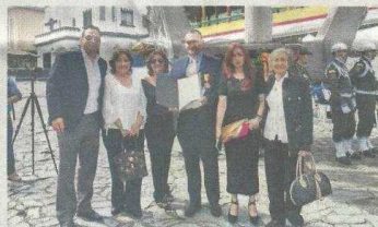
Mheo ha desarrollado toda su carrera como caricaturista desde Pereira.

“Gracias a esta ciudad, mi ciudad de subidas y bajadas, porque fue el escenario feliz donde me casé con una gran mujer, tuve una maravillosa hija y por muchos años disfruté de la ternura y el humor y de mi padre quien hace poco partió a la eternidad. Hoy agradezco poder seguir disfrutando de la compañía y el amor de mi madre”.