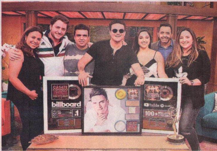
SILVESTRE DANGOND, orgulloso de obtener un Disco de Oro por la canción 'Justicia', la cual interpreta al lado de Natti Natasha.

trabajo musical", manifestó el músico, quien se hizo acreedor a las certificaciones por los álbumes Esto es vida, Sigo invicto, No me compares con nadie, El original y Gente Valiente. Este premio no es mío, este premio es de todos", dijo el cantante nacido hace 38 años en Urumita, La Guajira. Agregó que "ustedes son los que compran mi música.