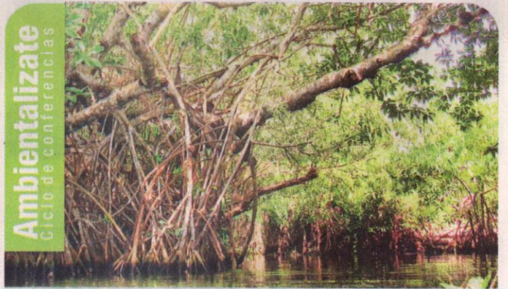
LOS CONVERSATORIOS como el de los manglares continuarán el próximo año en el Museo Bolivariano de Arte Contemporáneo.

complementaria en el Japan International desarrolló su curso de Conservation and Sustainable Management of Mangrov, en la Cooperation Agency el de Professional Open Water Dive Master y el Diplomado en Manejo Integrado de Zonas Costeras de la Universidad del Norte.