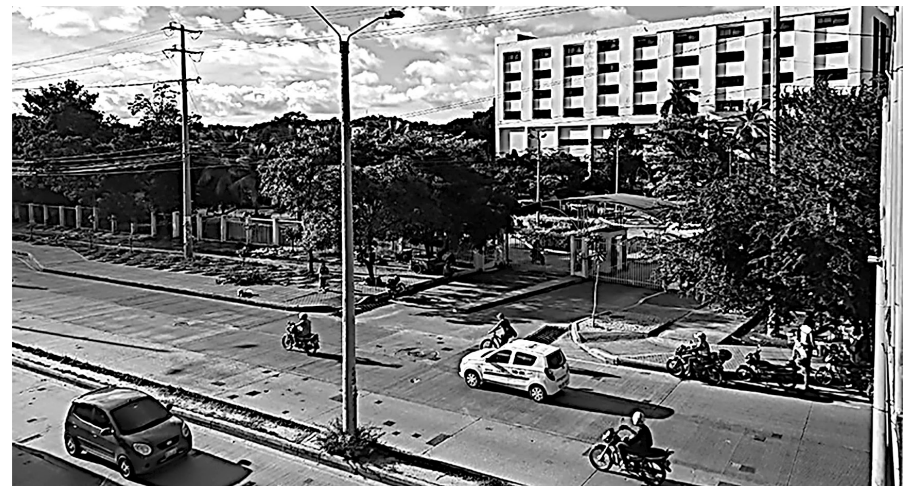
El próximo lunes 29 de octubre, el Dadis visitará a la Clínica del Bosque, para revisar si las falencias fueron superadas y así levantar la medida del cierre provisional.

La medida no interfiere con los tratamientos en curso de los pacientes allí hospitalizados, ni es necesario trasladarlos, pues las fallas no constituyen un riesgo para la vida misma de estos pacientes, Sin embargo, la Institución Prestadora de Servicios de Salud (IPS), no podrá recibir más pacientes mientras supera las falencias que le fueron encontradas. Mientras tanto las Entidades Promotoras de Salud (EPS), que tienen contrato con esta IPS deberán garantizar la prestación de los servicios de sus usuarios, a través de red prestadora de servicios