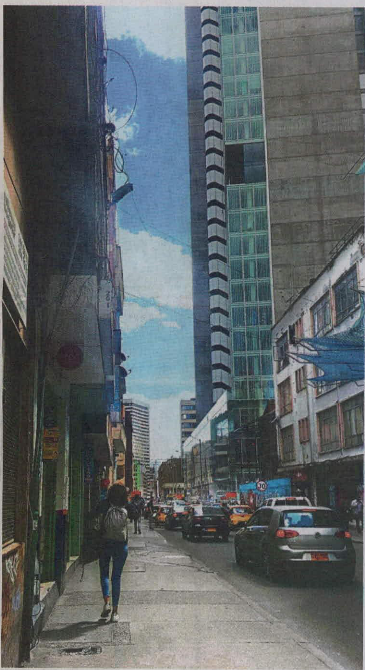
Vista de la carrera 5.ª hacia la calle 19 en el centro de Bogotá, que en un día soleado se ve oscura.