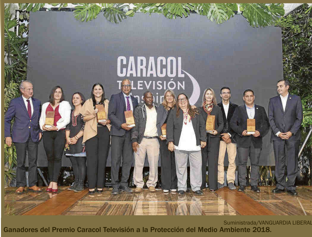
Ganadores del Premio Caracol Televisión a la Protección del Medio Ambiente 2018.