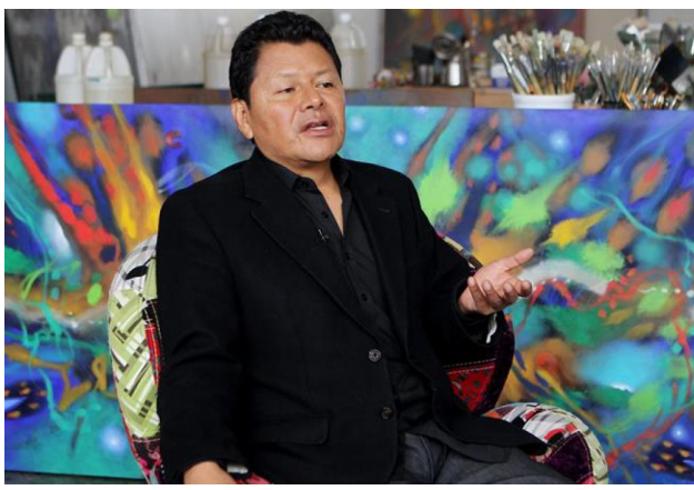
El pintor colombiano Carlos Jacanamijoy.

El Museo La Tertulia de Cali, creador y gestor de la iniciativa, detalló en un comunicado que van a premiar las tradiciones gastronómicas que rescatan los ingredientes autóctonos de las regiones median-