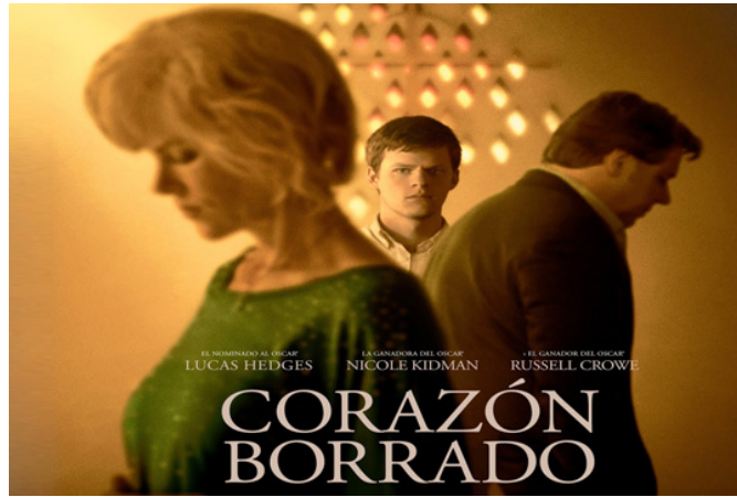
EN la Sala Country de la Cinemateca del Caribe desde las 4:00 p.m. podrás disfrutar de la película de drama 'Corazón borrado'. ¡No faltes!