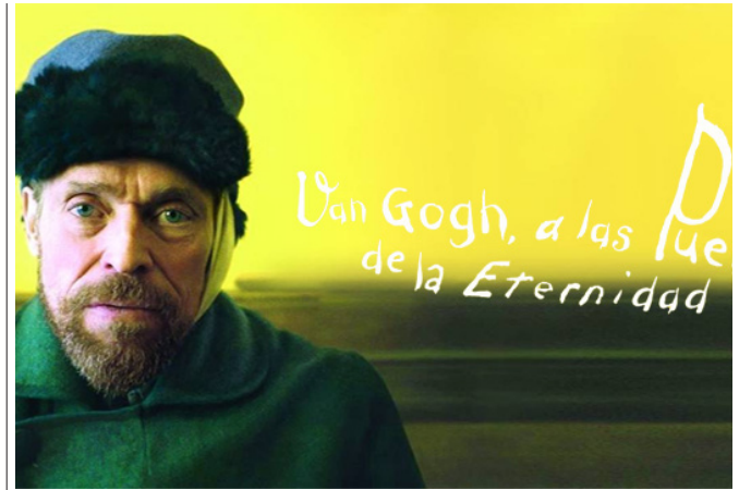
HOY en la Sala Country de la Cinemateca del Caribe a partir de las 6:15 pm se rodará la película 'Van Gogh, a las puertas de la eternidad' dirigida por Julian Schnabel.