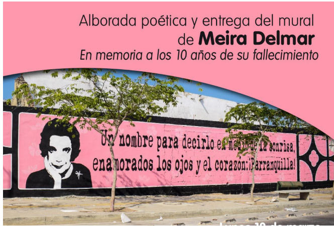
MAÑANA, a las 7:00 a.m. en el Par Vial de la Carrera 50, se realizará una alborada poética en el mural de Meira Delmar con motivo de los 10 años de su partida.