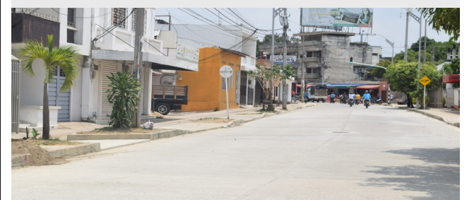
Sincelejo. La avenida Alfonso López se reabrió ayer después de meses de demolición de losas, renovación del sistema de alcantarillado sanitario y pavimentación.