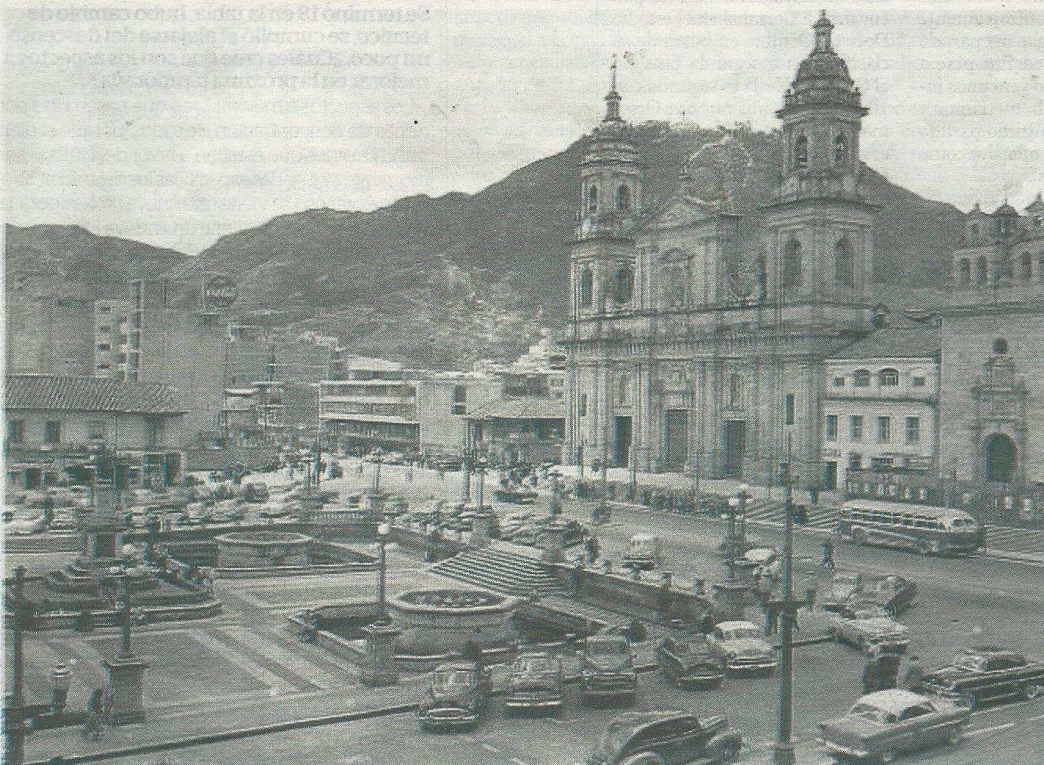
En 1946, muy cerca de la Plaza de Bolívar se daba la presencia más importante de actividades de alto rango y se concentraba la población de élite que habitaba allí desde la colonia.