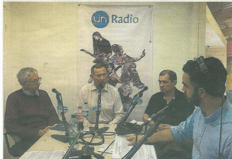
Transmisión del programa Observatorio de Gobierno Urbano desde la Filbo.

cafétera que dio mucho di- se invierte en las calles a el aeropuerto. Es una verdad económica y de listas muy modernos que versiones en el sector pú-