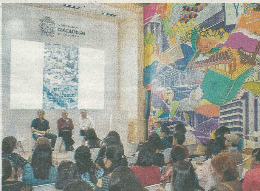
Conversatorio en el lanzamiento del libro Impacto de El Bogotazo en la actividad residencial y en los servicios de alto rango del centro de Bogotá.