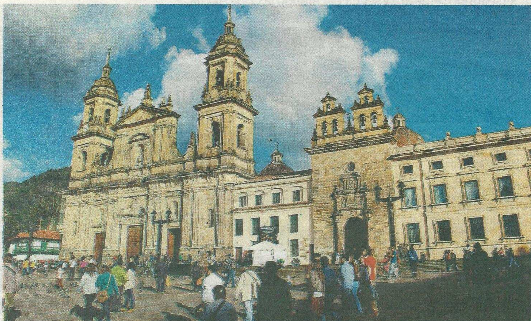
El centro de Bogotá no perdió protagonismo en el conjunto de la ciudad, puesto que pasó por un proceso de transformación profunda que le permitió continuar como el centro simbólico de la capital del país, condición que mantiene hasta hoy.

Para ello se analizaron algunas actividades relevantes como la residencia, los servicios profesionales —especialmente de médicos y odontólogos— y otros denominados “de alto rango”, como los bancarios, oficinas de representación, compañías de seguros, agencias de viajes, aerolíneas, hoteles, em-