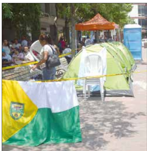
Con cambuches improvisados simpatizantes del movimiento Fuerza Ciudadana acompañan y apoyan desde afuera a los secretarios que permanecen en huelga de hambre.