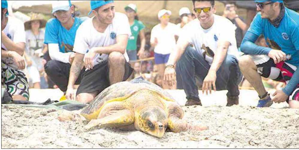
En la jornada de hoy liberarán setecientos ejemplares de tortugas caguamas o cabezonas (caretta caretta) y carey (eretmochelys imbricata).

En el marco del evento se realizará la liberación de 700 ejemplares de tortugas caguama o cabezona (caretta caretta) y carey (eretmochelys imbricata), provenientes de las playas del sector Mendihuaca - Don Diego, las cuales han estado en fase de levante entre