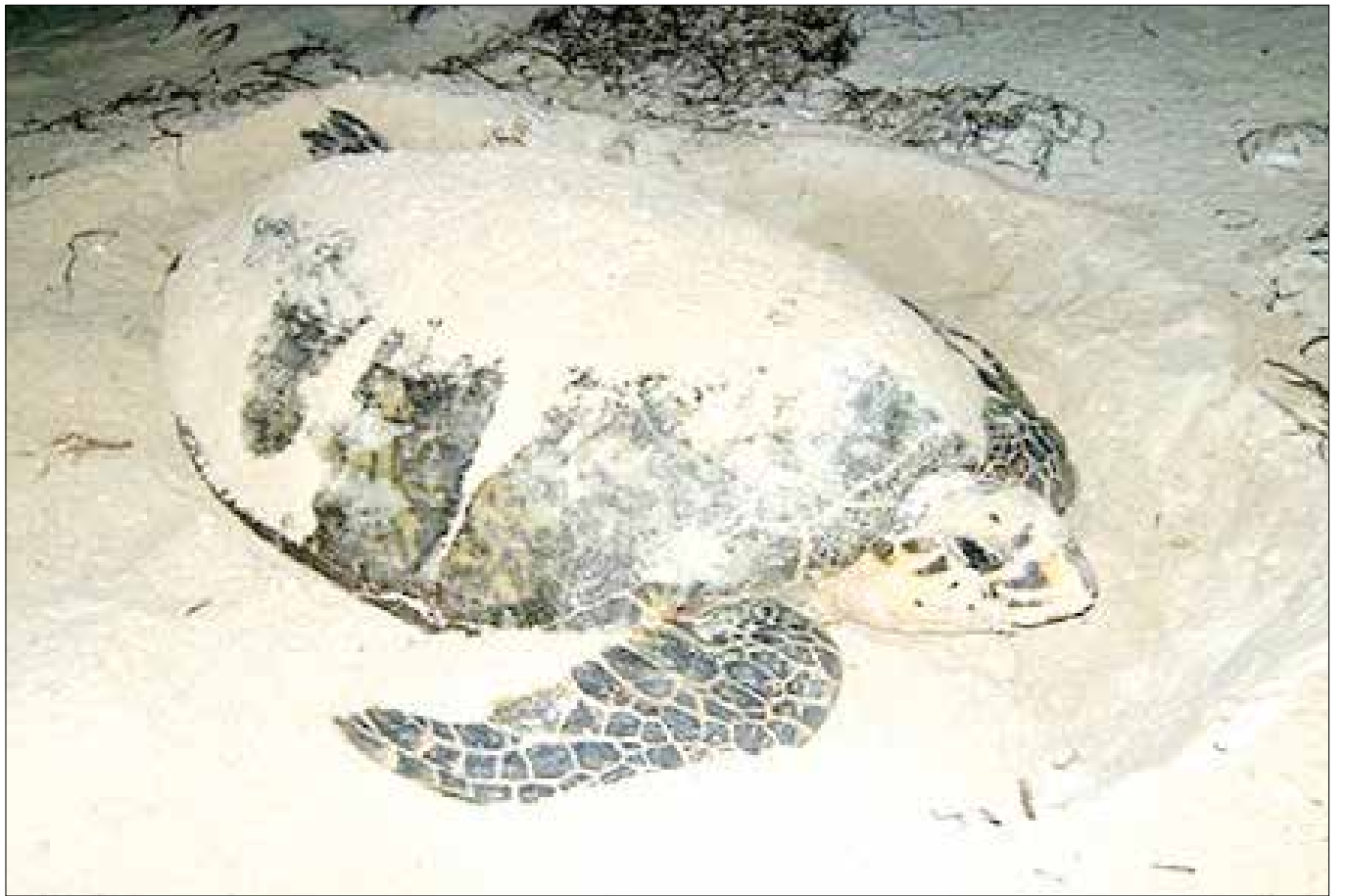
Tortuga carey.

leres de educación ambiental con los 'Voluntarios Proctmm', un grupo de niños de distintas edades y colegios de Santa Marta, que cada semana interactúan con las tortugas y aprenden acerca del cuidado de los recursos marino-costeros del país, así como, colegios y pescadores de la región.