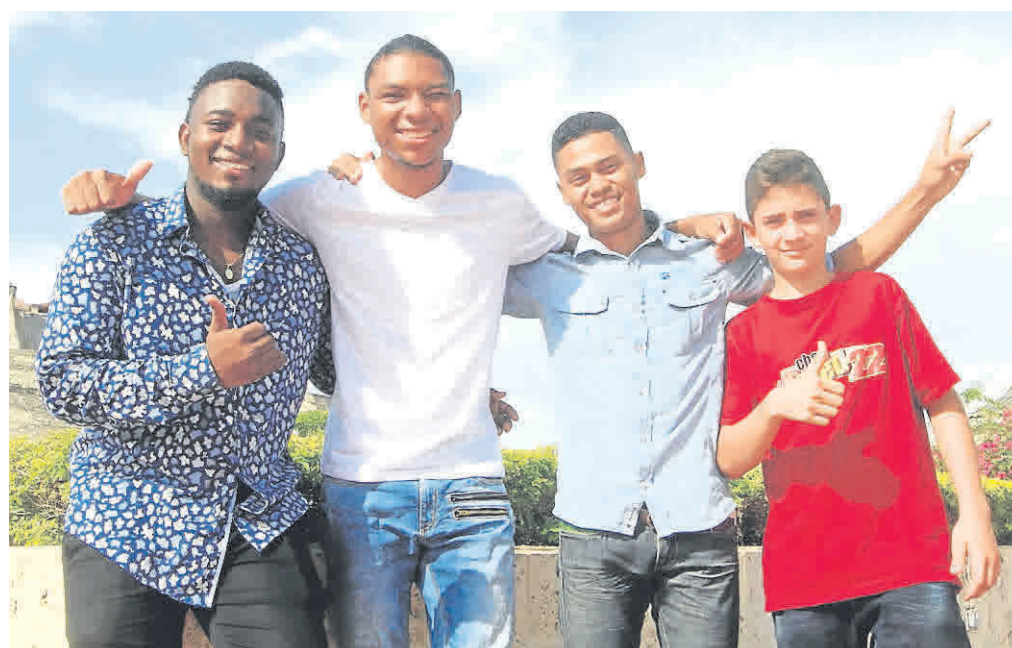
10 finalistas se disputarán este sábado el primer lugar en el programa, a las 9 a.m., en la Universidad de San Buenaventura.

Entre los premios que ganará el primer lugar de 'Talento de barrio' está una beca completa para estudios de música en Bellas Artes y regalos de patrocinadores como instrumentos, entre otros.