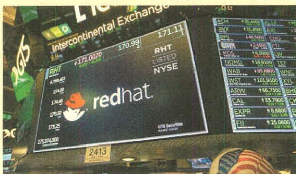
Red Hat representa la compra más grande en la historia de IBM.

millones de dólares es el monto por el que IBM compró el 100 % de las acciones de Red Hat. La operación fue de US$190 por acción.