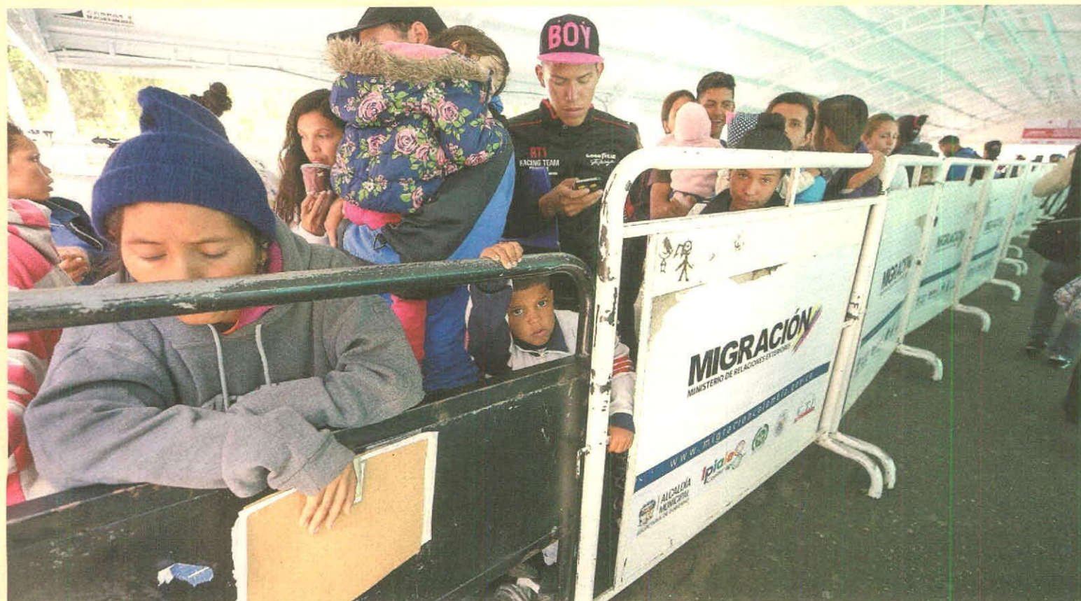
De acuerdo con el Banco de la República la inmigración venezolana se ha incrementado como porcentaje en la población económicamente activa.

Este movimiento de población venezolana hacia Colombia probablemente contribuyó a aumentar la participación laboral urbana.