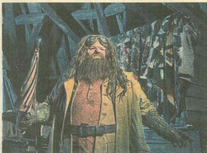
La figura animada Hagrid cuenta con un perfil de movimiento extenso, con 24 posturas corporales y expresiones faciales.

Universal's Endless Summer Resort, el séptimo hotel de Universal Orlando Resort, abrió recientemente sus puertas ofreciendo una vibra de playa y 750 habitaciones. Cuenta con piscina en forma de tabla de surf, área de comida y suites de dos habitaciones con un cupo máximo para seis personas. El hotel inicia temporada con tarifas bajas: 73 dólares la noche por una estadía de siete noches.