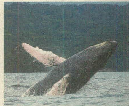
En su adultez pueden pesar hasta 40 toneladas.