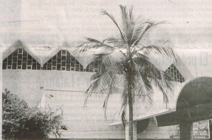
TEATRO Amira de la Rosa.

es el de salvaguardar el patrimonio de la ciudad siendo éste un espacio emblemático para los barranquilleros, teniendo en cuenta el Plan de Manejo Especial de Protección (Pemp), puesto que el sector está regulado por una normativa de protección. Teniendo en cuenta que el Teatro Amira de la Rosa está vinculado al Plan Nacional de Teatros, liderado por el Ministerio de Cul-