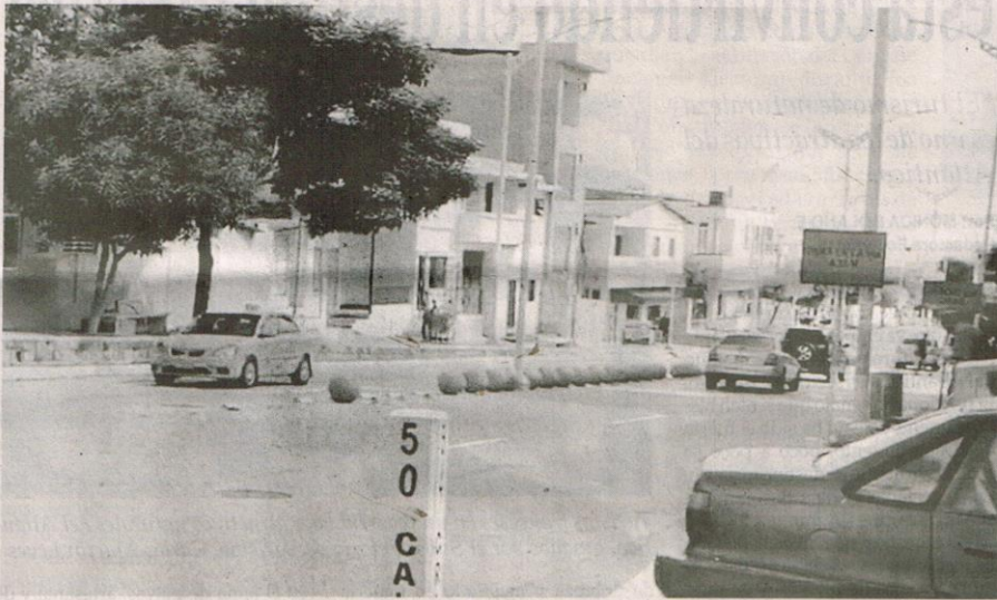
SECTOR de la carrera 54 con 50.

A este problema se le suma la inseguridad, ya que los habitantes comentaron que en horas críticas de la madrugada y de la noche el sector es solo y como les toca recorrer grandes distancias para poder encontrar un bus que les sirva, muchos de los moradores han sido víctimas de atraco