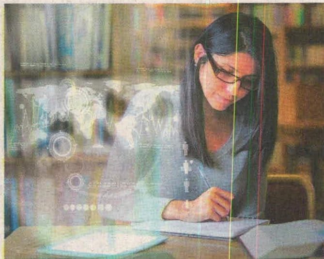
Hoy las empresas buscan personas que tengan la capacidad de ver los negocios holísticamente en un mundo interconectado.

Page Colombia, compañía perteneciente a PageGroup, cuenta que el ámbito laboral necesita profesionales más preparados, más abiertos y con visión integral de los negocios. “Que sepan sobre el comportamiento de los mercados globales y el acceso que se puede tener a ellos a través de las diferentes oportunidades que ofrece la economía mundial”, añade. La integralidad es otra de las cualidades que buscan las multinacionales en sus encargados de comercio exterior. Liévano asegura que, además de tener conocimientos técnicos, “hoy las empresas buscan personas que tengan la capacidad de ver los negocios holísticamente en un mundo interconectado y de ampliar el campo de acción de sus negocios. Con talento de establecer relaciones fácilmente, de estar al día con la actualidad legislativa y comercial y, claramente, profesionales que no tengan barreras para comuni-