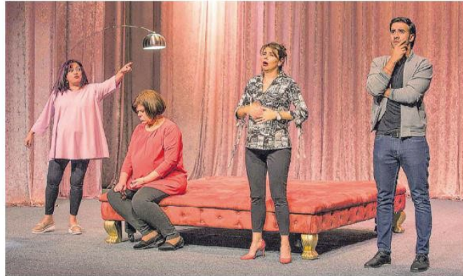
En medio de situaciones absurdas, ellas intentarán cumplir su deseo de vida.

TEATRO 'TRES', COMEDIA QUE CIERRA TEMPORADA DEL FANNY MIKEY.